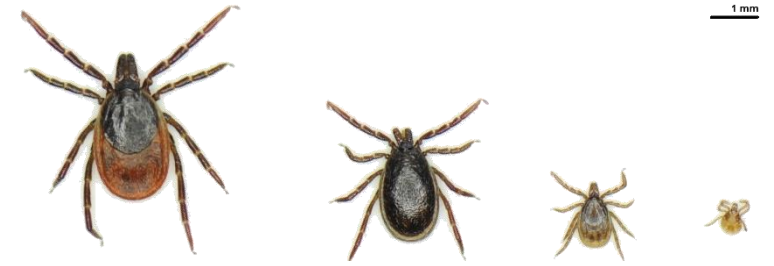
La tique Ixodes ricinus . De gauche à droite: femelle (3.5-4.5mm), mâle (2.5-3.5mm), nymphe (environ 1.5mm), larve (environ 0.5mm)

A chaque stade de son évolution, la tique a besoin de se nourrir de sang. Elle se fixe sur la peau d'un hôte et y pompe du sang pendant plusieurs jours. Pendant ce temps, son corps s'accroît jusqu'à former une sphère. Une fois repue, la tique se laisse tomber sur le sol, où elle digère le repas sanguin. Elle peut alors accomplir sa mue pour passer de larve à nymphe ou de nymphe à adulte. Une tique adulte femelle pond plusieurs milliers d'oeufs puis elle meurt. A tous les stades de son développement, la tique Ixodes ricinus peut se fixer sur l'être humain et transmettre un agent pathogène qui peut provoquer une maladie chez son hôte.